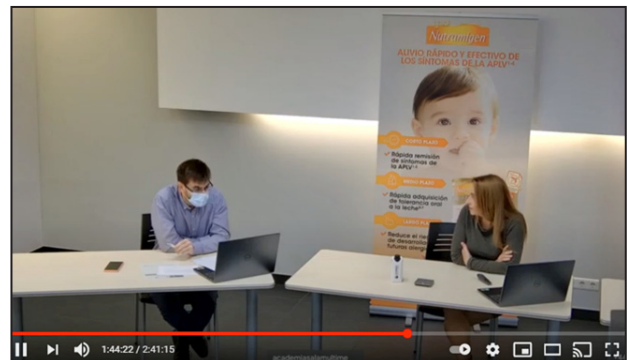
Jornada d'Actualització en Gastroenterologia Pediàtrica per a Atenció Primària, VII edició.