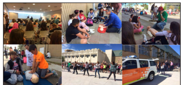
Fig. 1. Taller de Suport Vital pels nens de 6è d'educació primària Reunió Anual. Blanes 2017.