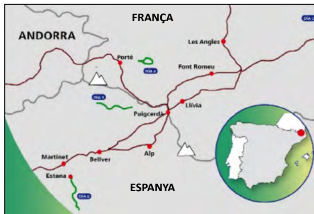
Fig. 1. Ubicació de les comarques de l'Alta i la Baixa Cerdanya i el Capcir.

A la banda francesa, l'assistència primària de pediatria és a càrrec de metges generalistes, agrupats en cases de salut ( maisons de santé ), que actuen sota un règim lliberal 3 . La Caisse d'Assurance Maladie (Caixa d'Assegurança de Malalties) es fa càrrec del 75% del cost dels actes mèdics i la resta va a càrrec del pacient 4 . El Pôle Pédiatrique de Cerdagne (PPC),